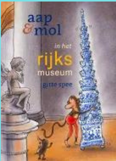
Aap en mol in het Rijksmuseum Gitte Spee