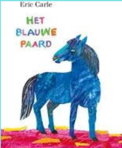
Het blauwe paard Eric Carle